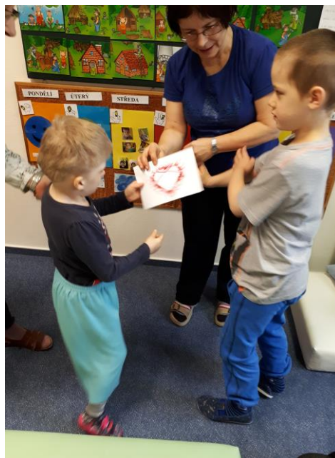
Foto: Rozdávání Valentýnských přáníček

V uplynulém školním roce byly dětem nabídnuty zájmové kroužky, žáci pracovali v kroužku logiky, čtenářském kroužku. V rámci šablon také probíhalo doučování žáků. Škola průběžně plnila plán práce školy.