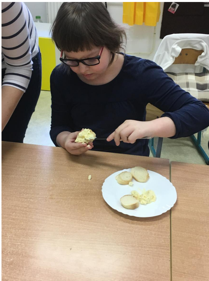
Den s pomazánkou

V jedné rehabilitační třídě působily tři pedagogické pracovnice, v další třídě působily dvě pedagogické pracovnice, z nichž jedna byla vychovatelka. Ve třídách speciální školy pracovalo v září 2017 šestnáct asistentů pedagoga v přepočtu 15,5 úvazku. Ve školním roce 2017/2018 byly tři oddělení školní družiny z toho jedna ranní družina a dvě odpolední oddělení a pět výchovných skupin internátu. Noční dohled nad žáky zajišťovaly dvě pracovnice.