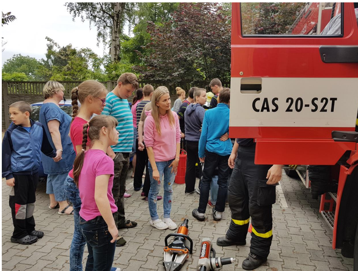
Cvičný požární poplach

Tyto činnosti jsou prováděny v souladu s možnostmi mentálně postiženého žáka pochopit danou problematiku. Témata vedoucí k ochraně životního prostředí byla pravidelně zařazována do týdenních pokynů a probrána s žáky. Podrobný plán akcí je součástí školní dokumentace. Škola je přihlášena do programu M.R.K.E.V., pravidelně odebíráme časopis Bedrník. Součástí školního vzdělávacího programu jsou projektové dny, které svým zaměřením obsahují problematiku ochrany životního prostředí.