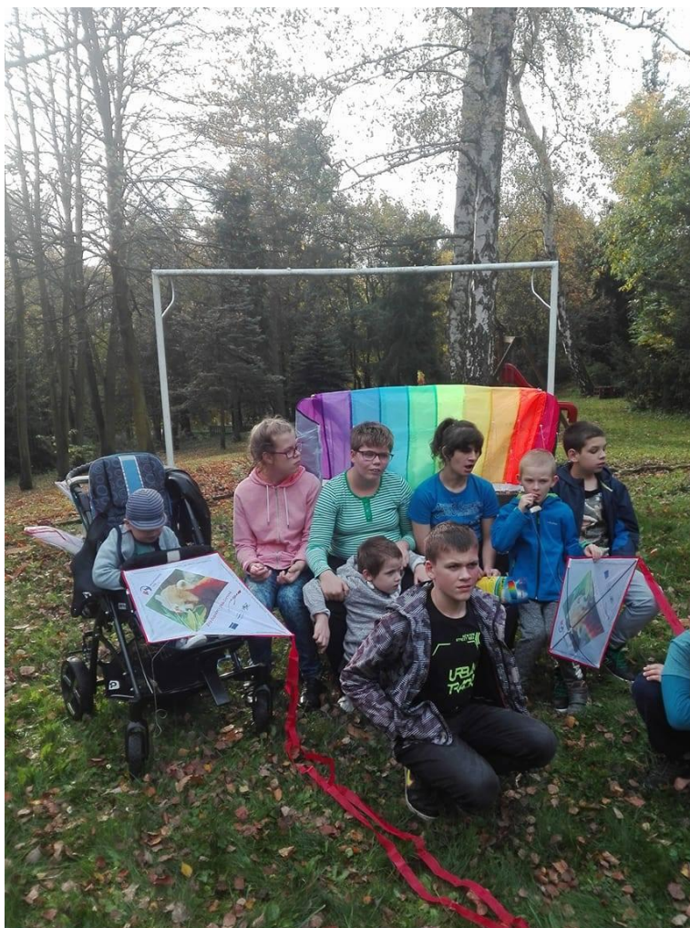
Pouštění draků - internát