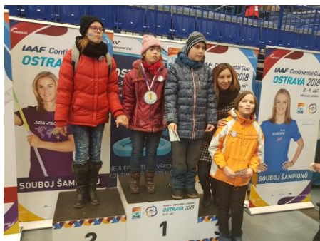
Návštěva Olympijské vesnice