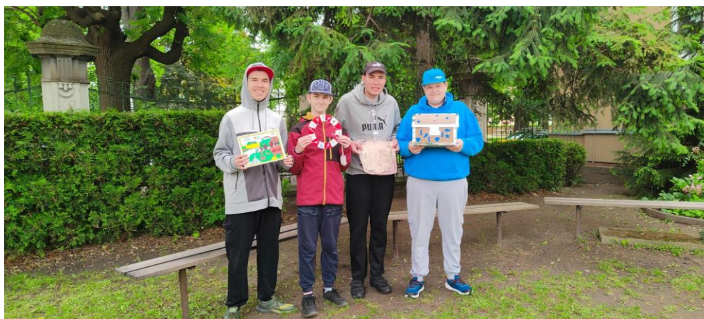
Sportovní den v Opavě

Pedagogové vždy respektují individuální vzdělávací a výchovné potřeby žáků, respektují jejich pracovní tempo. Každý žák má zpracované portfolio žáka nebo v případě doporučení SPC jako podpůrné opatření, individuální vzdělávací plán a výchovný plán, který vychází ze ŠVP a opírá se o dovednosti a vědomosti již nabyté a podle potřeby jednotlivých žáků rozvíjí další oblasti vzdělávání a výchovy. Pedagog musí respektovat zvláštnosti každého jednotlivého dítěte nebo žáka a přizpůsobit výukový program jeho potřebám. V rámci pedagogického působení spolupracujeme s SPC pro mentálně postižené, pro tělesně postižené, pro sluchově postižené a také s SPC pro děti a žáky s autismem.