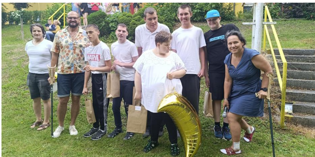
Vítání léta s končícími žáky

Školská rada je důležitým orgánem ve vzdělávacím systému, který hraje klíčovou roli při správě a řízení školního zařízení. Její činnost se zaměřuje na podporu kvality vzdělávání, rozvoj školního prostředí a komunikaci mezi různými zainteresovanými stranami. Školská rada je informována o veškeré činnosti ve škole.