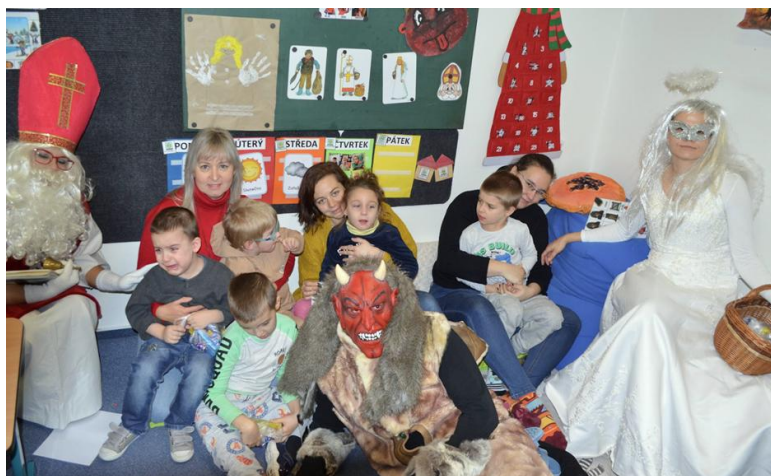
Mikuláš navštívil žáky školy