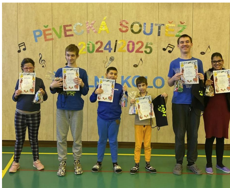
Školní kolo v pěvecké soutěži