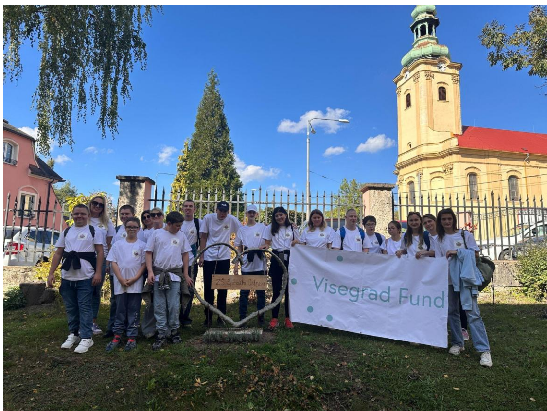
Visegrad Fund v Ostravě