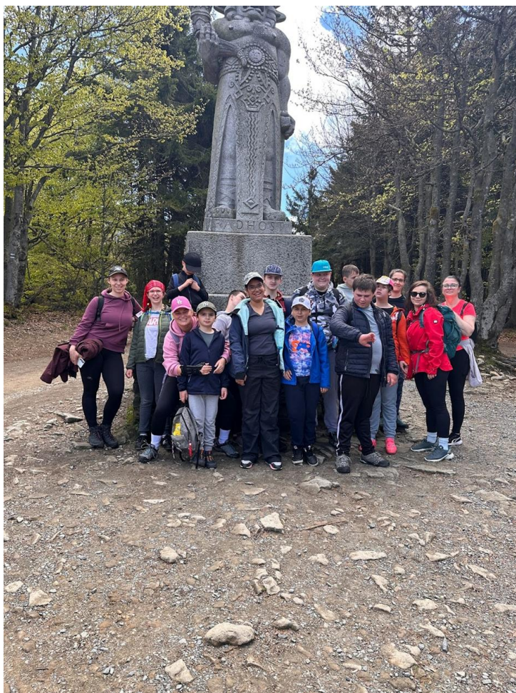
Škola v přírodě horní Bečva