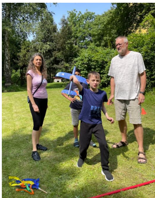
Hry bez hranic