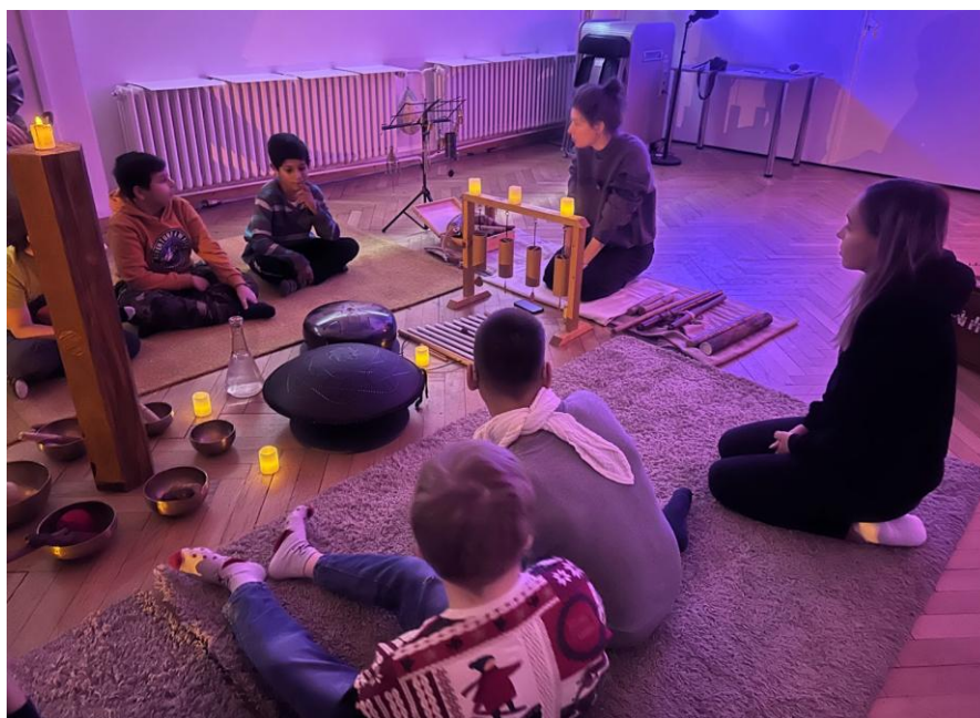
Muzikoterapie v GVUO