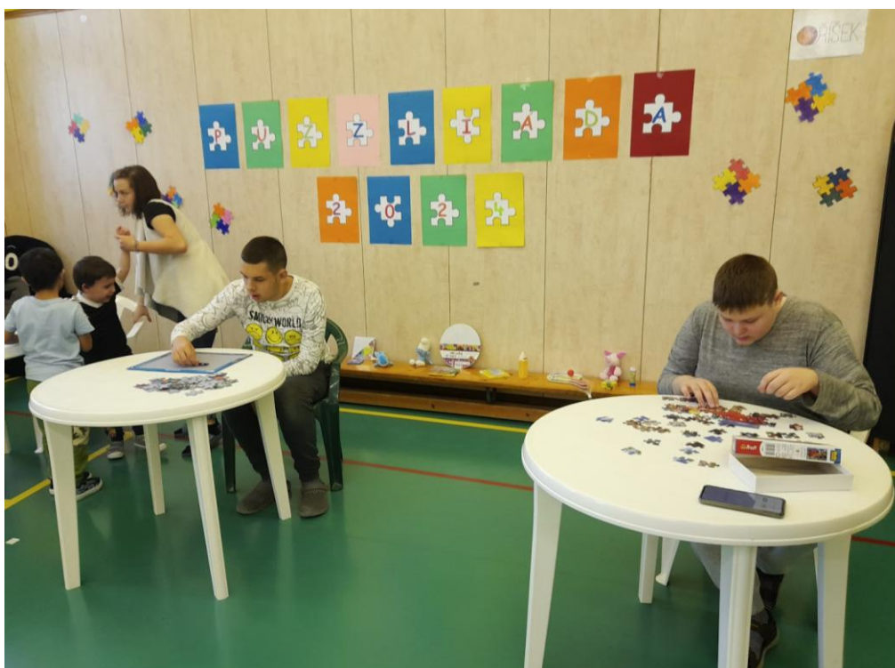
Puzliáda - městské kolo

Aktivní zapojení školy do projektu Moravskoslezského kraje TPA