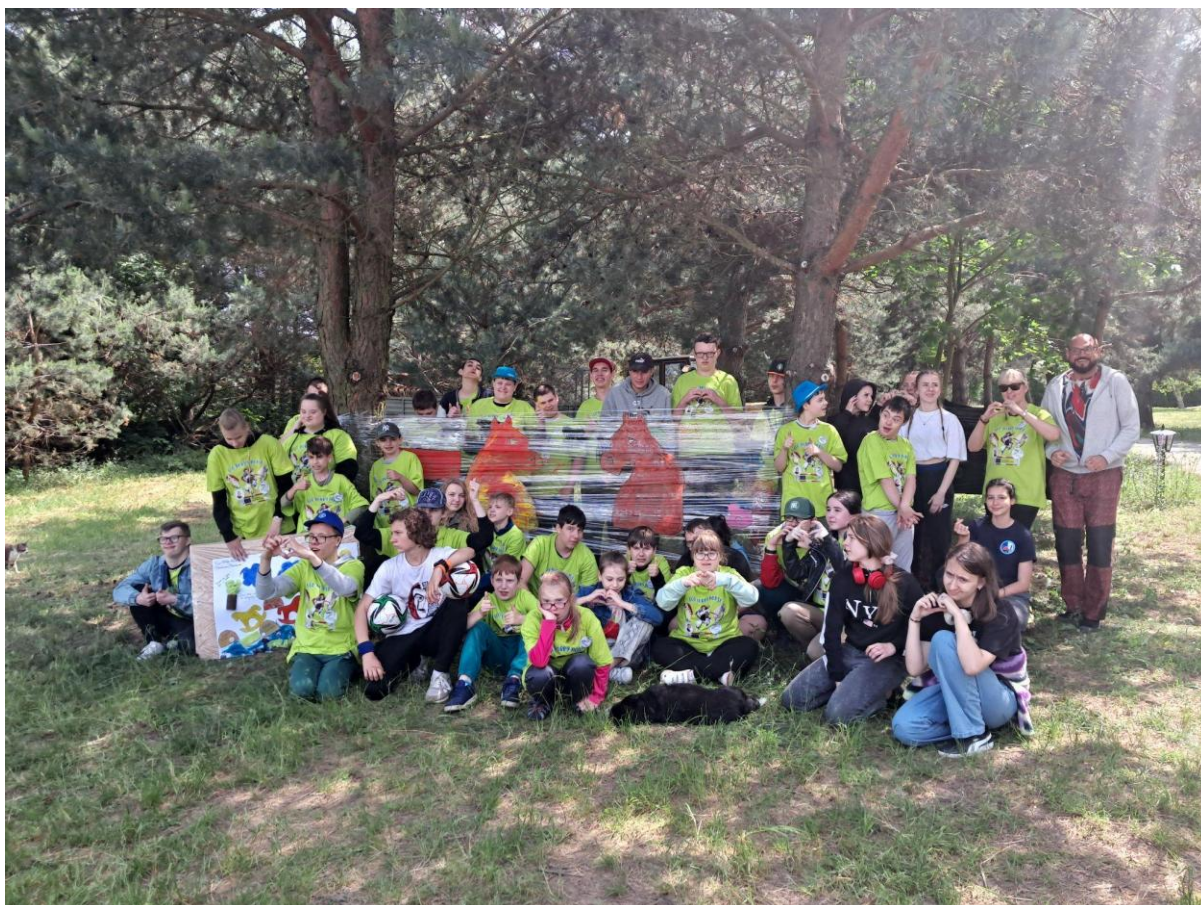
Erasmus Polsko - Radom - Eco Hobby Horse

Následně od 8. - 15. června 2025 pokračovaly projektové aktivity Erasmus+ v Polsku, během nichž byla zahájena spolupráce se školou v Radomi.