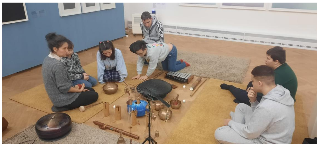
Muzikoterapie v GVUO

Rozvinul se nám zde nešvar, že rodiče mají tendenci dávat nemocné děti nebo děti s úrazem na internát školy. Někteří rodiče také odmítají si během týdne vyzvednout nemocné dítě z internátu školy. Jedni rodiče nedodržují podmínky přijetí žáka na internát a to tím, že nedodávají aktuální změny dávkování léků a tím ohrožují zdraví svého dítěte.